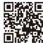
電子保証の仕組み